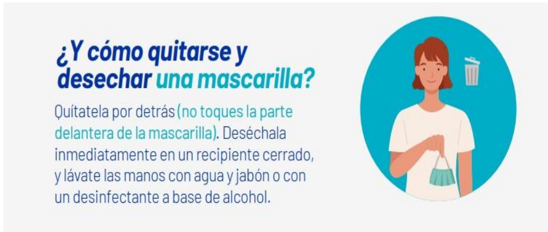
Ilustración 4 Como retirarse la mascarilla

En aquellos lugares de trabajo en donde no sea posible garantizar las condiciones óptimas de ventilación, se establecerá la necesidad de usar el tapabocas como medida complementaria.