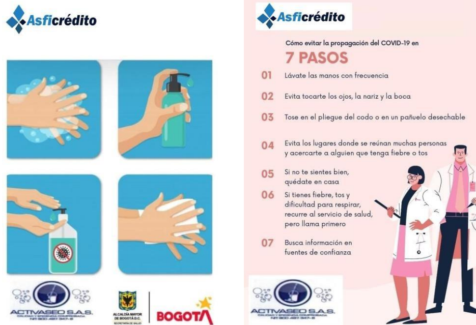
Ilustración 1 Técnica lavado de manos

Se ha publicado la técnica de lavado de manos en las instalaciones, sedes y lugares de trabajo de la Compañía: