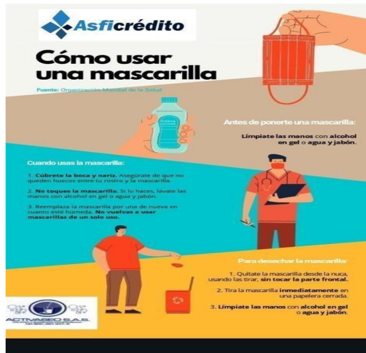
Ilustración 2 Como usar una mascarilla